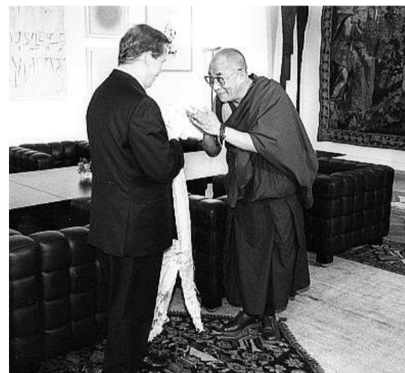
S dalajlamou V dobách „prezidentování“ i po odchodu z Hradu Václav Havel vytrvale podporoval politicky pronásledované lidi na celém světě. S tibetským duchovním dalajlamou se sešel několikrát. Snímek je z přijetí dalajlamy na Pražském hradě.