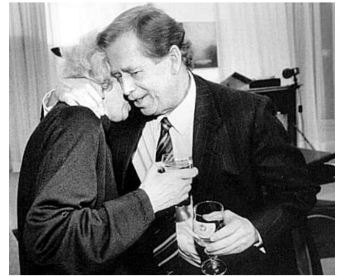
S Olgou Snímek s první manželkou Olgou je z ledna 1993, kdy byl Václav Havel po půlročním neprezidentském období a po vzniku samostatné České republiky zvolen prvním českým prezidentem. Olga Havlová tři roky poté zemřela na rakovinu. Prezident se pak oženil s herečkou Dagmar Veškrnovou.