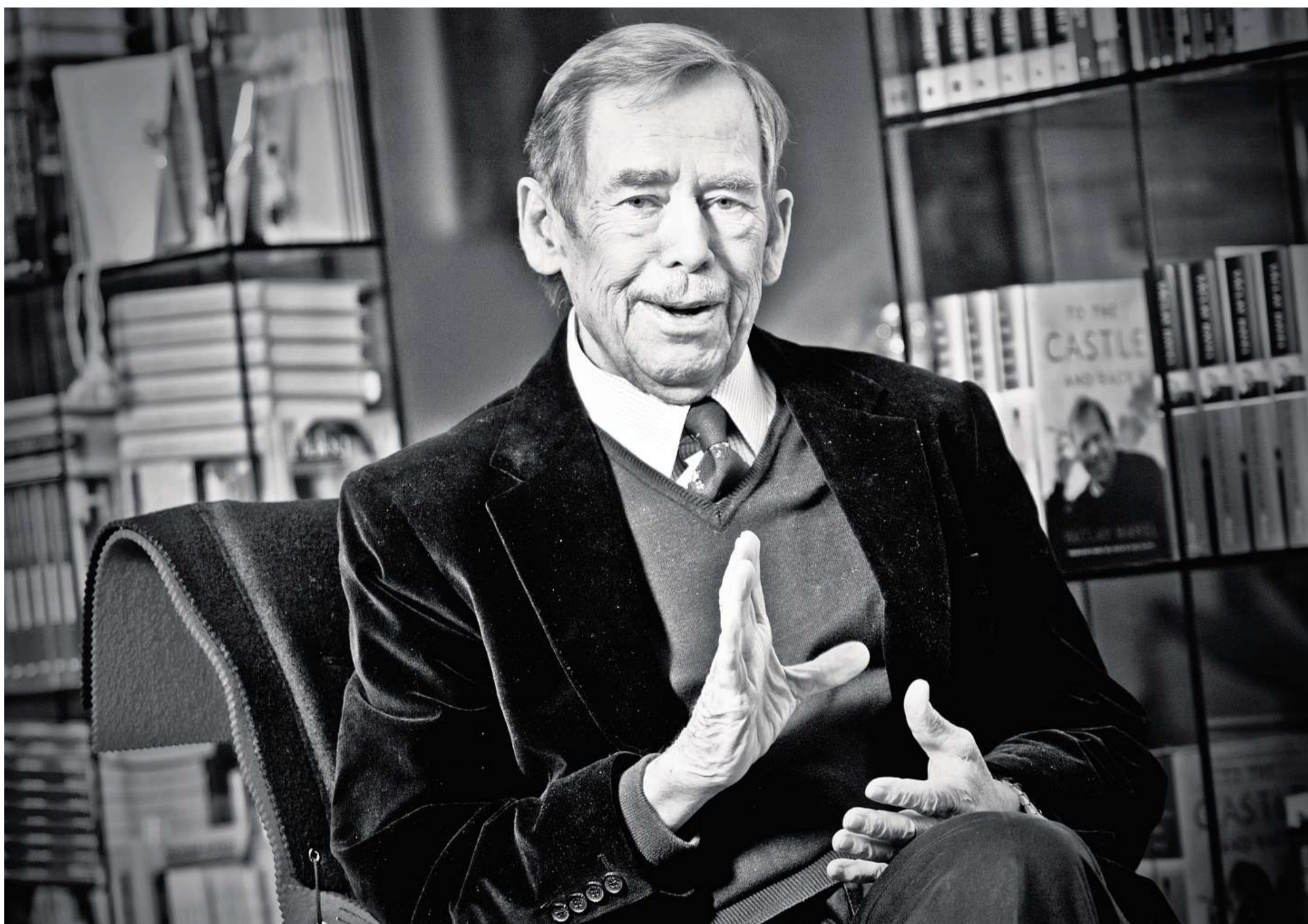
Václav Havel, skromný velký muž „Například lidé nevědí, jak mě oslovovat. Někdo mi říká pane prezidente, někdo říká pane bývalý prezident, někdo říká pane Havel, a já čekám, až někdo řekne: Pane bývalý Havel,“ řekl o své roli exprezidenta Václav Havel v roce 2006. Od dnešního dne lze bohužel o Václavu Havlovi mluvit už jen v minulém čase.