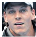
Tomáš Berdych tenista

Jednoznačně pro Švejnara. Osobně ho znám déle než Klause, setkávali jsme se i v době té divoké privatizace, která u nás proběhla. Tehdy jsem poznal jeho názory, od té doby je nezměnil. A toho si velmi vážím.