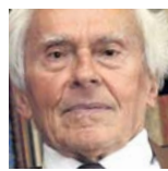
Miroslav Zikmund cestovatel

Jednoznačně pro Švejnara. Osobně ho znám déle než Klause, setkávali jsme se i v době té divoké privatizace, která u nás proběhla. Tehdy jsem poznal jeho názory, od té doby je nezměnil. A toho si velmi vážím.