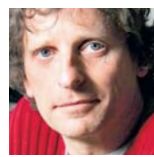
David Prachař herec

Mám ráda změnu, proto bych raději na tomto místě viděla Jana Švejnara. U Václava Klause mi vadí jeho arogantní tón a výraz. Docela ráda bych se proto podívala do přívětivějšího obličeje. U Klause navíc nesouhlasím s jeho názory na ekologii a životní prostředí.