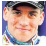
Zdeněk Štybar cyklokrosař

Osobně bych dal přednost panu Švejnarovi, do boje o post prezidenta jde s lidským přesvědčením, má určité iluze. Z tohoto důvodu si myslím, že i Václav Havel byl dobrý prezident, republiku dokázal proslavit ve světě, udělal jí dobrou image. Myslím si, že u nás je především potřeba ozdravit politiku, lidé se o ni totiž přestávají zajímat, protože mají pocit, že nic nezmění. Osobně bych byl například i pro přímou volbu prezidenta. Lidé jsou u nás obecně znechuceni politikou, vidí zaprodance a špinu nalevo i napravo. Z tohoto pohledu není pan Švejkar spojený s politikou. Myslím si, že z hlediska pomoci národu by to byla dobrá volba.