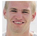
Ondřej Synek veslař

Oba uznávám jako kvalitní ekonomy. Ale při pohledu na vývoj kampaně Jana Švejnara mi připadá, že se až moc podbízí levicovým volitelům, i těm komunistickým. Dříve jsem ho považoval za odborníka, liberálního ekonomu, to teď trochu v kampani popírám. Chápu, že je to součást hry, ale mně se to nelíbí. Navíc Klaus mě jako prezident příjemně překvapil – i přesto, že je to názorový „folkař“, jsou jeho postoje a názory dlouhá léta konzistentní.