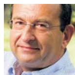
Cyril Höschl psychiatri

Volil bych profesora Švejnara, neboť jeho názory a vize týkající se např. přijetí eura, ekologie a otázek globalizace jsou mně bližší. Navíc si myslím, že některými prohlášeními a názory (například Evropská unie, globální oteplování, atd.) dělá současný prezident naší zemi medvědí službu a chybí mu i potřebná sebereflexe od jeho nejbližších spolupracovníků.