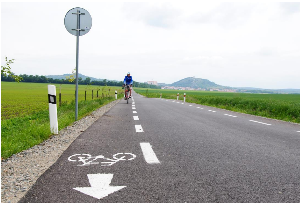
příklad z Mikulova.