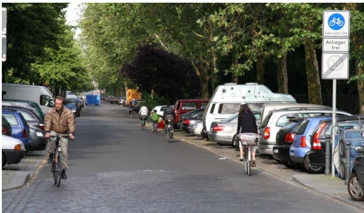
příklad použití „Cyklistické ulice“ z Berlína