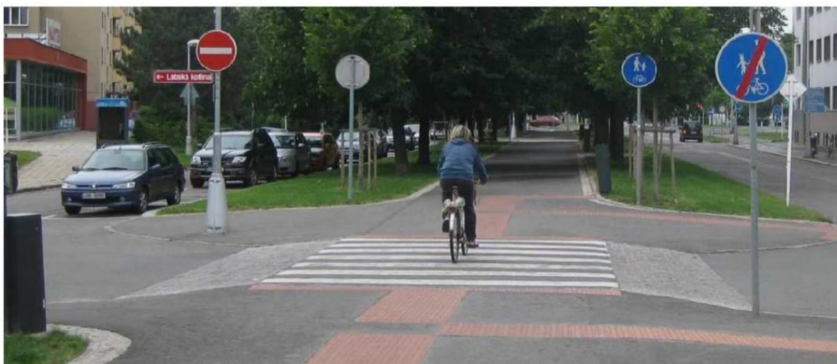
Hradec Králové - tady by měl cyklista podle zákona sesednout a kolo převést.

(6) Je-li zřízena stezka pro chodce a cyklisty označená dopravní značkou "Stezka pro chodce a cyklisty", na které je oddělen pruh pro chodce a pruh pro cyklisty, je cyklista povinen užít pouze pruh vyznačený pro cyklisty. Pruh vyznačený pro chodce může cyklista užít pouze při objíždění, předjíždění, otáčení, odbočování a vjíždění na stezku pro chodce a cyklisty; přitom nesmí ohrozit chodce jdoucí v pruhu vyznačeném pro chodce.