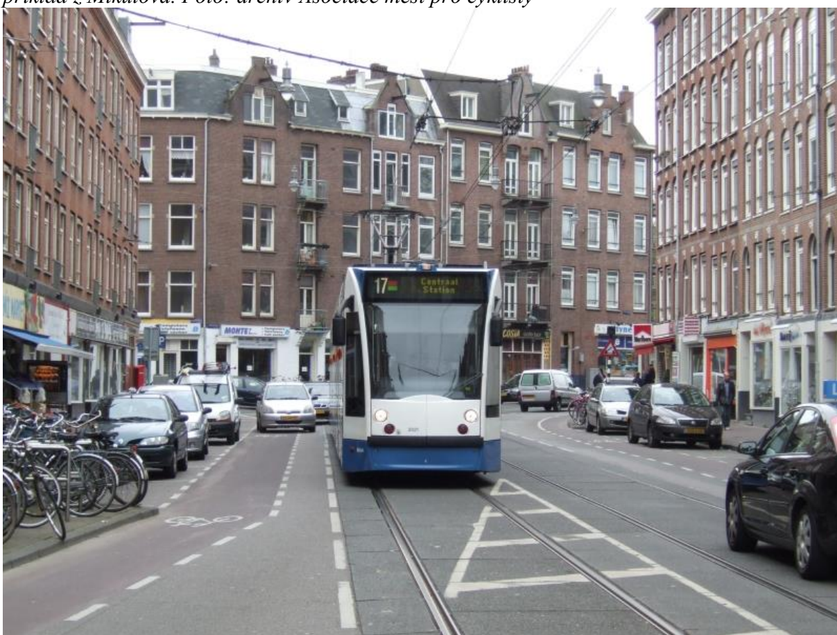
příklad současného použití v zahraničí (Nizozemsko)