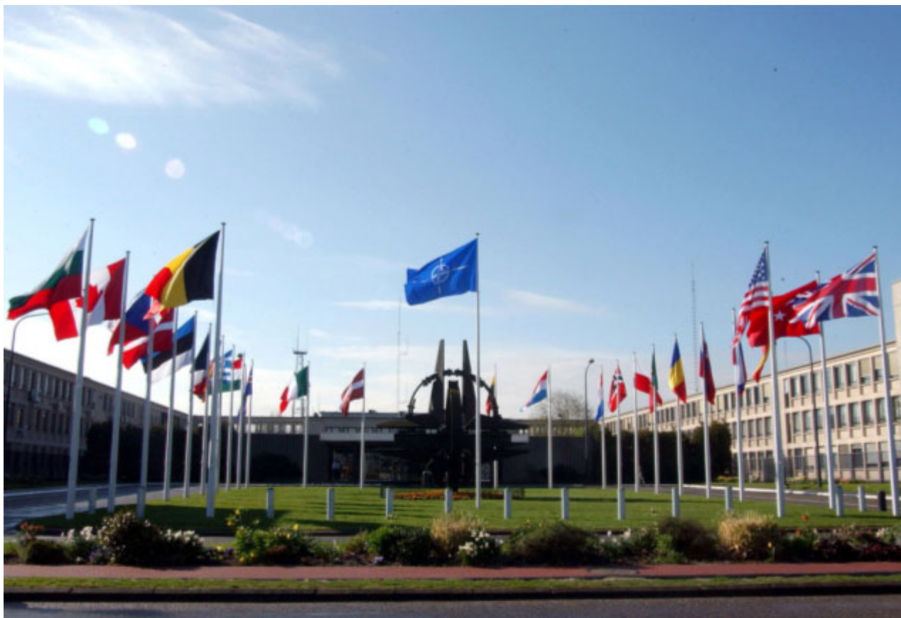
Lidé NATO věří: Severoatlantická aliance je jakožto organizace demokratických zemí založena i na důvěře obyvatel jejích členských států. A ta nyní stoupá.

Vnímání operace v Afghánistánu evropskou a americkou veřejností pravděpodobně v dalších letech ovlivní vnímání Severoatlantické aliance jako celku, i když nelze vyloučit, že významnější roli v tomto vnímání veřejnosti začne hrát Rusko. Už podle letošního a loňského průzkumu, které - jak jsme již poznamenali - proběhly před rusko-gruzínským konfliktem letos v létě, se ruského chování vůči svým sousedům obává většina Evropanů (58 procent) i Američanů (69 procent). Bez práce zdá se NATO nebude. Jestli na ni bude stačit, to se teprve uvidí. ●