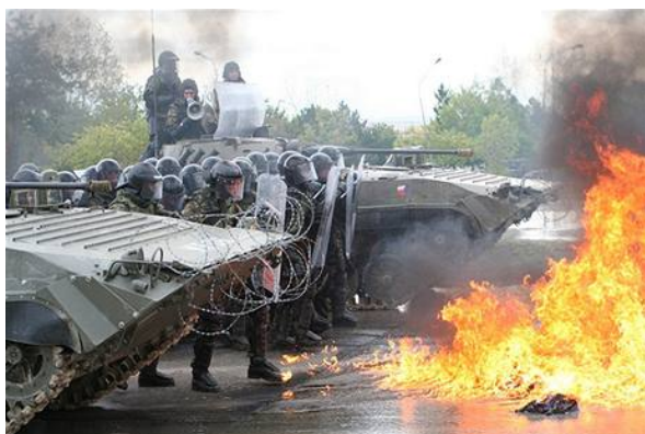
Zvládnutí davu: Při svém posledním povolání do Kosova nacvičovala česká záložní rota i zvládnutí davu. Je možné, že toho využije při svém případném dalším nasazení v roce 2009.

Ve stávající podobě bude probíhat i zapojení českých vojáků do operace Trvalá svoboda (Enduring Freedom) v Afghánistánu, v níž působí stovka příslušníků 601. skupiny speciálních sil z Prostějova. Ti odcestovali počátkem září, k jejich rotaci by mělo dojít v lednu a červenci 2009.